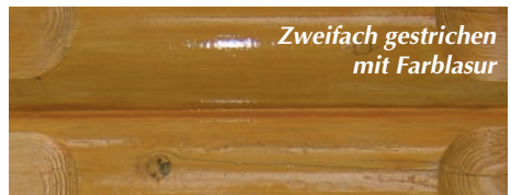
Zweifach gestrichen mit Farblasur

Naturöl'. Ohne vorheriges Anschleifen, erhalten alte Blockhäuser mit einem opaken Pigment ihren 'holzfrischen' Farbton wieder.