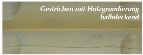
Gestrichen mit Holzgrundierung halbdeckend