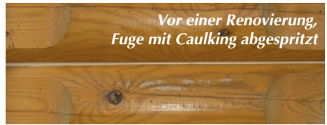
Vor einer Renovierung, Fuge mit Caulking abgespritzt

Diotrol wurde bereits von der Deutschen Blockhaus Akademie erfolgreich getestet und dementsprechend empfohlen. Es lässt sich auch mit Chinking-Produkten verwenden.