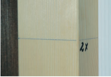
Doppelter farbloser Auftrag unter der Kennlinie und der Original-Farbtönen oben an einem Fensterprofil.

prozess des Naturöls durch Verkochen erlaubt den Verzicht auf Pestizide und Biozide. Dementsprechend ist 'Diotrol' schadstofffrei deklariert und kann im Innen- und Außenbereich zum Einsatz kommen. Zudem wird 'Diotrol' in der 'Öbox', Liste der in Österreich geförderten, ökologischen Baustoffe ( www.oeobox.com ), als einziges schadstofffreies Holzschutzmittel geführt.