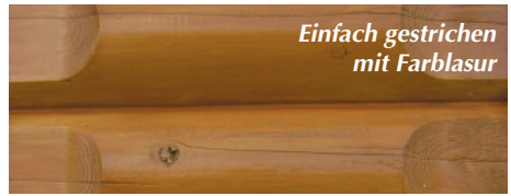
Einfach gestrichen mit Farblasur