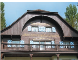
Althaus nach Restaurierung.