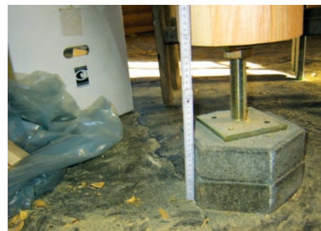
Selbst bei einer relativen Holzfeuchte von 20% gilt es, fast 5 cm Setzung zu berücksichtigen.

cm. Hierbei ist die montagebedingte Setzung zunächst nicht berücksichtigt.